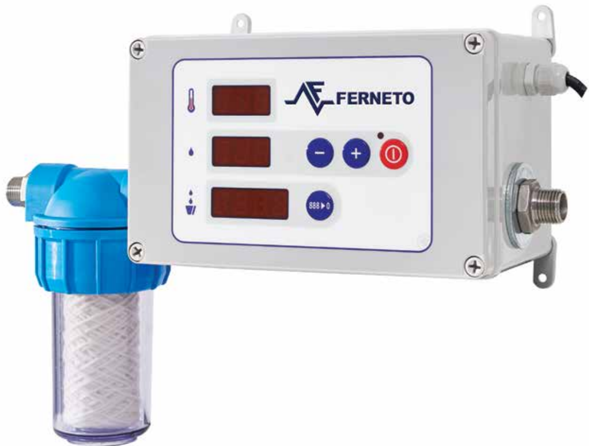
DOSEADOR DE ÁGUA WATER METER / CUENTALITROS / DOSEUR D'EAU